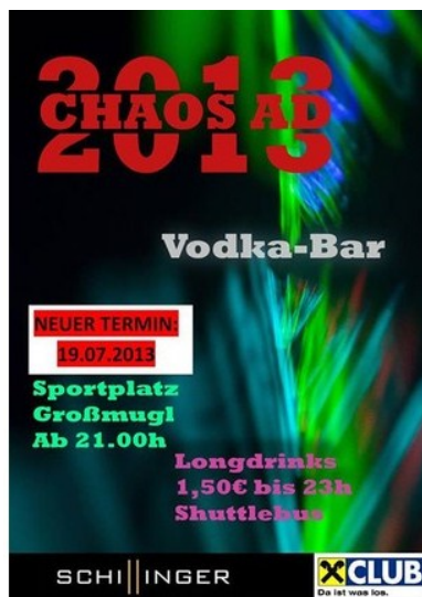
Party am Sportplatz Großmugl